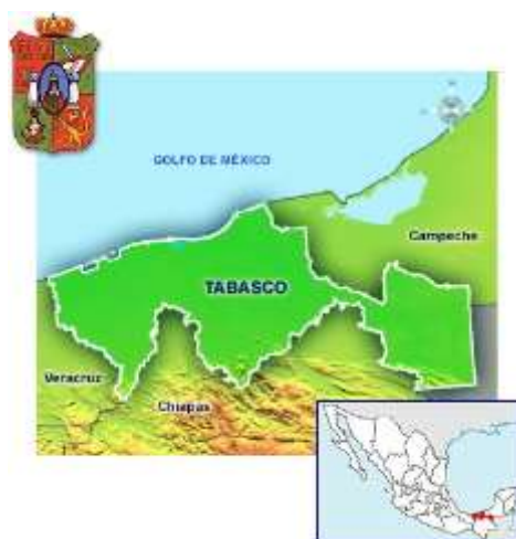
Figura 1. Mapa iconográfico de Tabasco por gobierno de Tabasco

costera; en algunas partes del sur por los ríos Mezcalapa, Pichucalco, Chacamax y Usumacinta; al este, por los ríos San Pedro y San Pablo, al noroeste, por el río Tonalá.