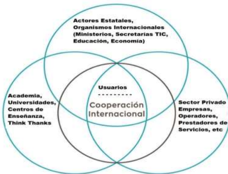
Grafico 1. Modelo de múltiples partes interesadas

22